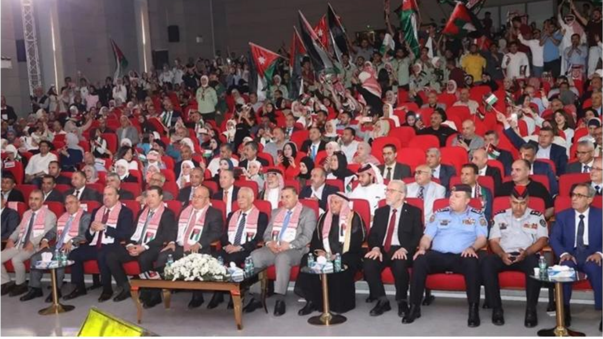
العيسوي يرعى احتفالات الجامعة الهاشمية بالعيد الـ80 لاستقلال المملكة